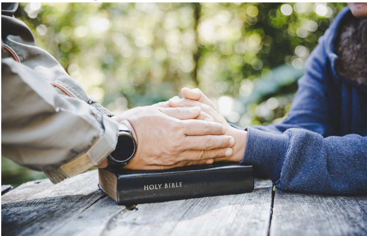
Figura 6 - A Bíblia tem ensinamentos para evitar preocupação