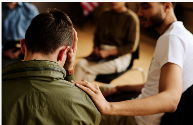
Figura 2 - A fé é um refúgio para as preocupações

A fé, em muitas tradições religiosas, é vista como um refúgio ou uma força diante das adversidades da vida, incluindo as preocupações. Porém, quando essas preocupações se tornam excessivas, elas podem abalar a fé de um indivíduo, levando a questionamentos e dúvidas. Por outro lado, a fé também pode oferecer recursos para lidar com essas preocupações, através de ensinamentos, práticas espirituais e o apoio da comunidade de fé.