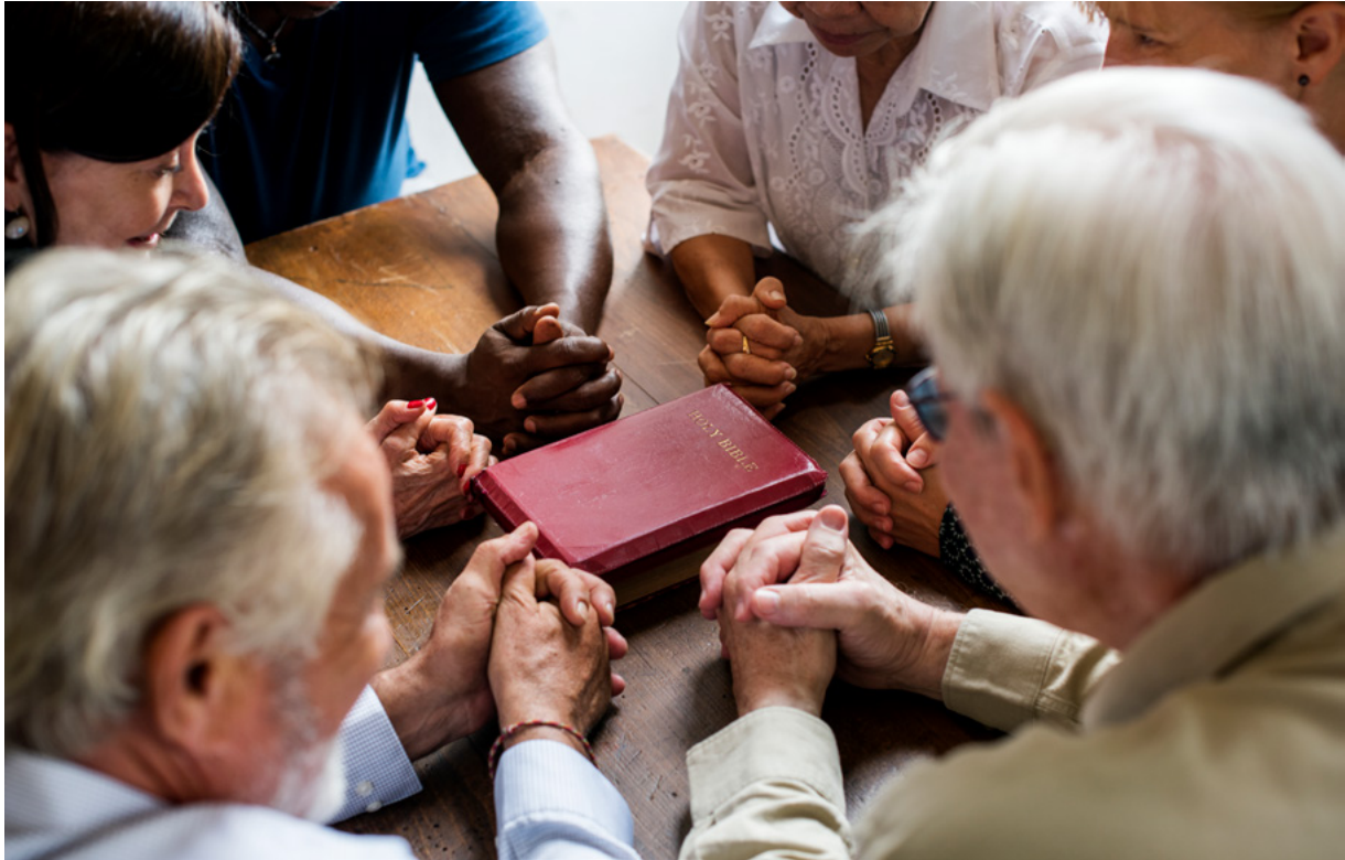
Figura 3 - Oração e atividade sociais evitam preocupação