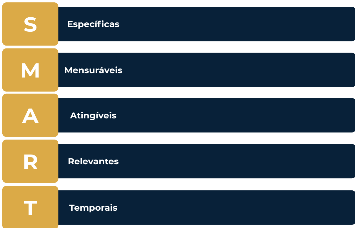
Figura 5 - Técnica SMART