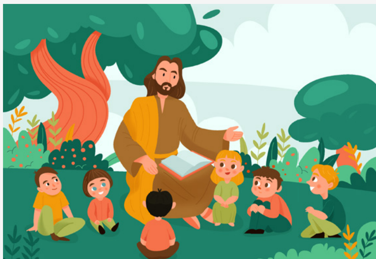
Figura 7 - Jesus contando parábolas para crianças

Além de estabelecer uma conexão emocional, o uso de narrativas na educação espiritual também simplifica conceitos complexos, tornando-os mais acessíveis e mais fáceis de entender. Histórias e parábolas são capazes de ilustrar ideias abstratas de maneira concreta e tangível, facilitando a compreensão e a retenção a longo prazo das lições ensinadas. As narrativas não são apenas meios de comunicação emocionalmente envolventes, mas também ferramentas cognitivas poderosas para a educação e o desenvolvimento espiritual..