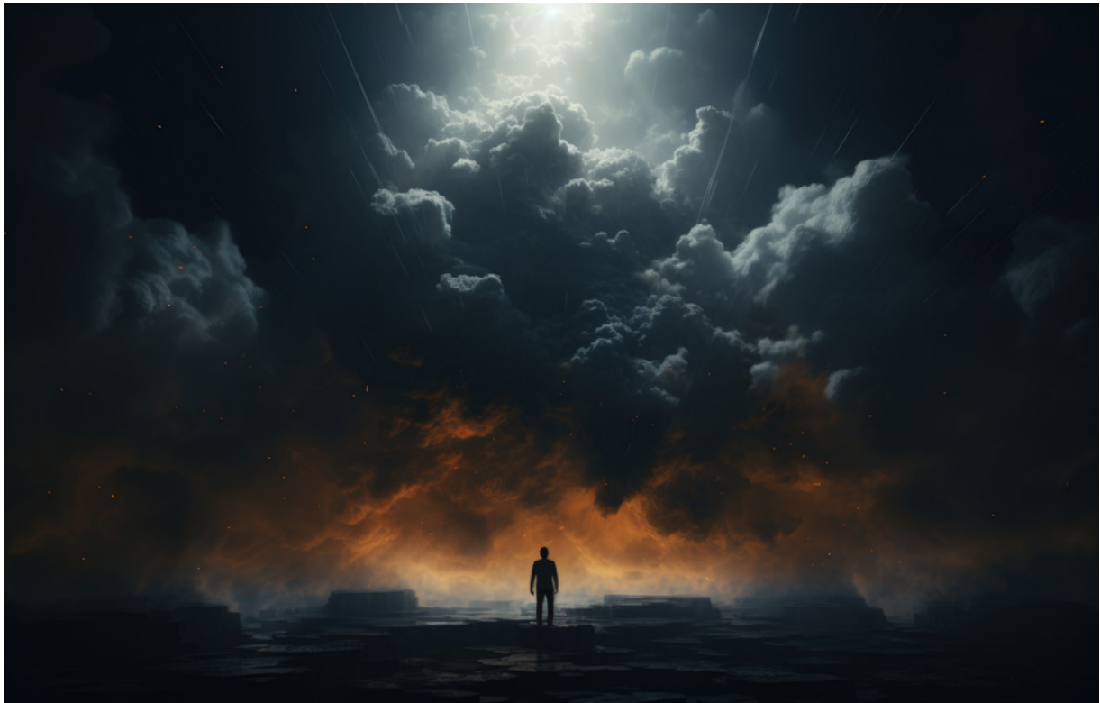
Figura 1 - Luz além da preocupação