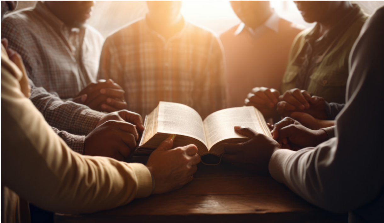
#paratodosverem: Seis pessoas em pé, ao redor de uma mesa de madeira, segurando uma bíblia aberta. Ao fundo, a luz do sol entra por uma janela e ilumina o ambiente.

A aplicação prática da pregação expositiva envolve a conexão dos princípios extraídos do texto bíblico com a vida cotidiana dos ouvintes. Essa aplicação visa ajudar a congregação a entender como aplicar os ensinamentos bíblicos em suas próprias vidas, relacionamentos e circunstâncias. Sendo assim, entender a aplicação prática da pregação expositiva é crucial por várias razões, destacando a relevância e o impacto dessa abordagem na vida das pessoas e na comunidade de fé.